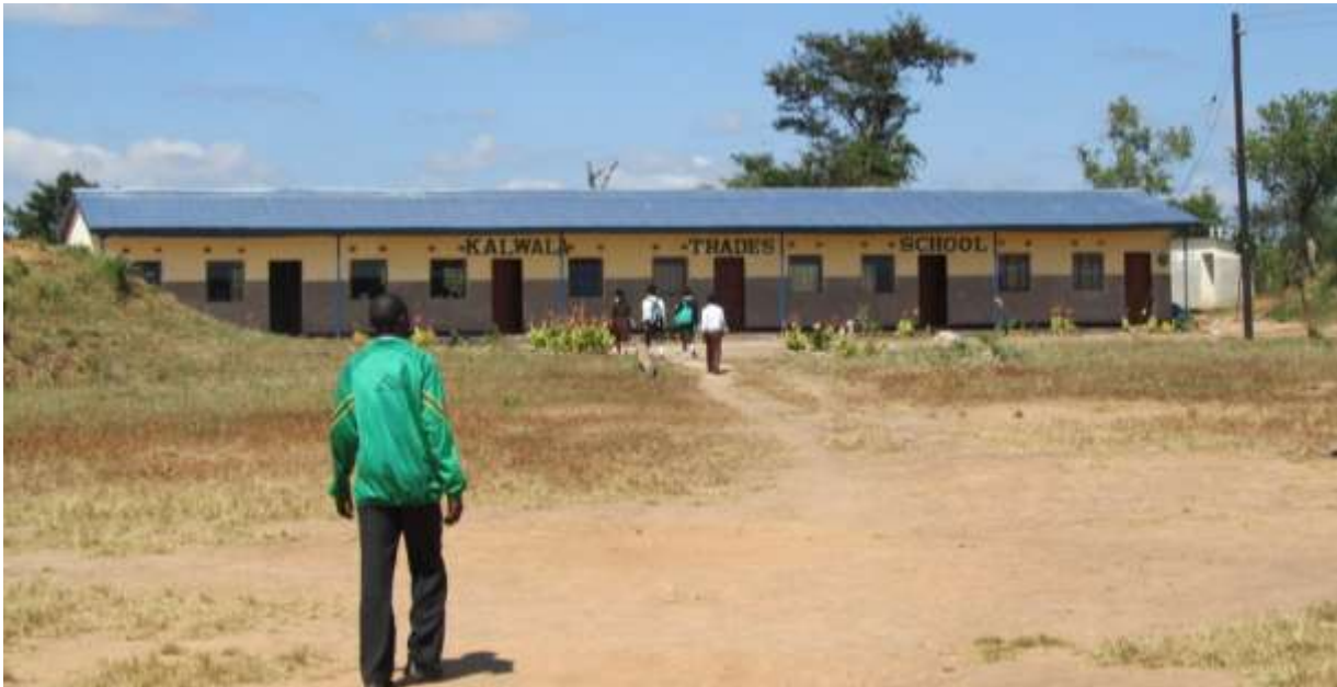
Kalwala Trades School